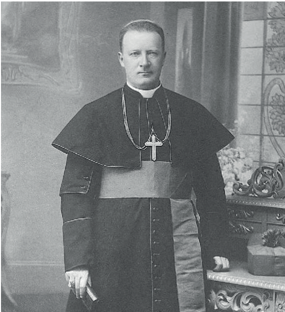
Św. Józef Bilczewski 1860 – 1923